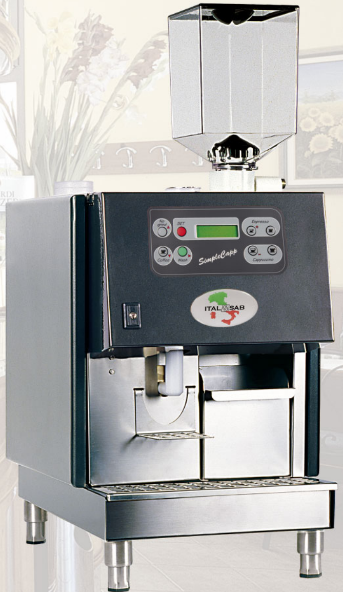
SIMPLECAPP (100 Cups/hour)