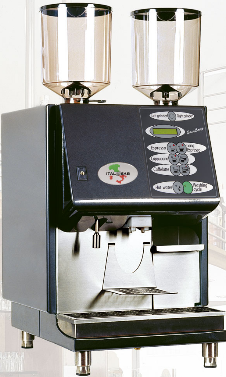
EASYCAPP (120 Cups/hour)